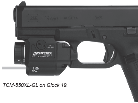
TCM-550XL-GL on Glock 19.